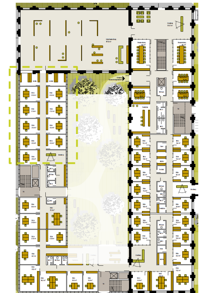
Aus der Machbarkeitsstudie der Halfmann Architekten